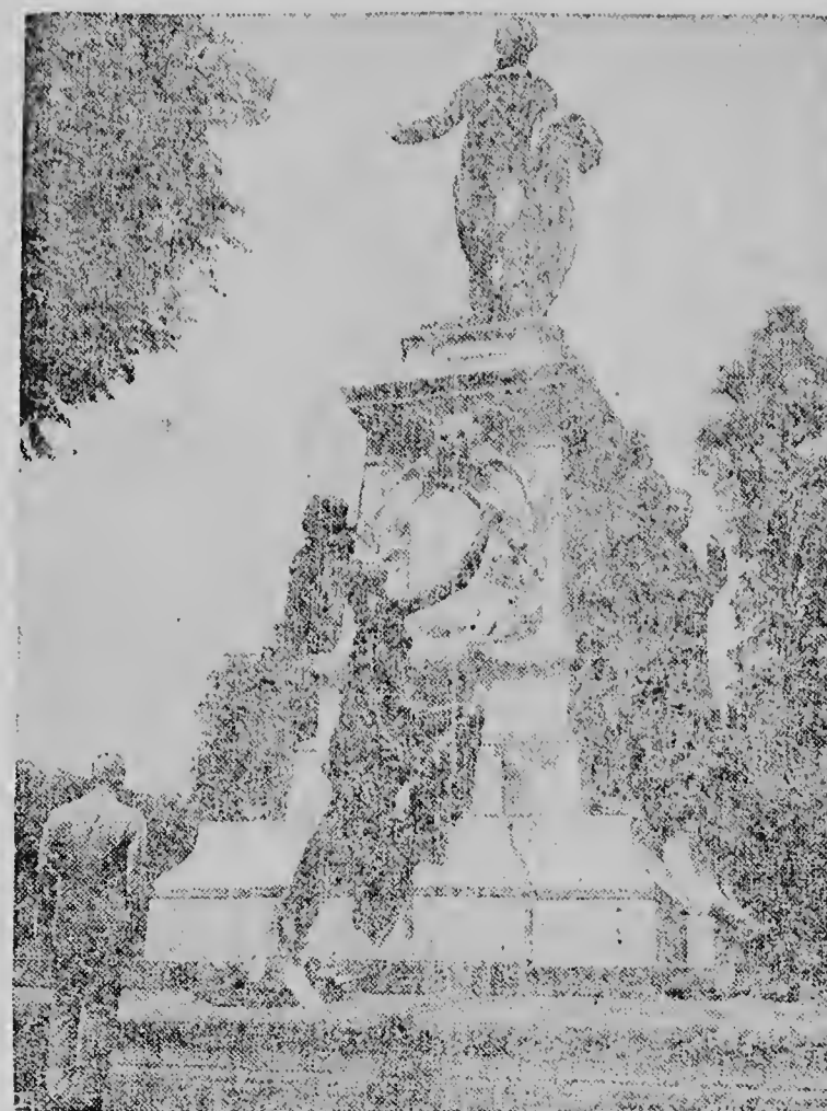
President Eisenhower aan de voet van het monument voor de Franse Generaal Lafayette, nadat hij er een kruis heeft geplaatst. Het standbeeld staat in het Lafayettepark tegenover het Witte Huis en de ceremonie vond plaats in verband met de herdenking van de 119de verjaardag van de sterfdag van de Franse Generaal die samen met de Amerikanen streed in de dagen van de Amerikaanse revolutieoorlog.